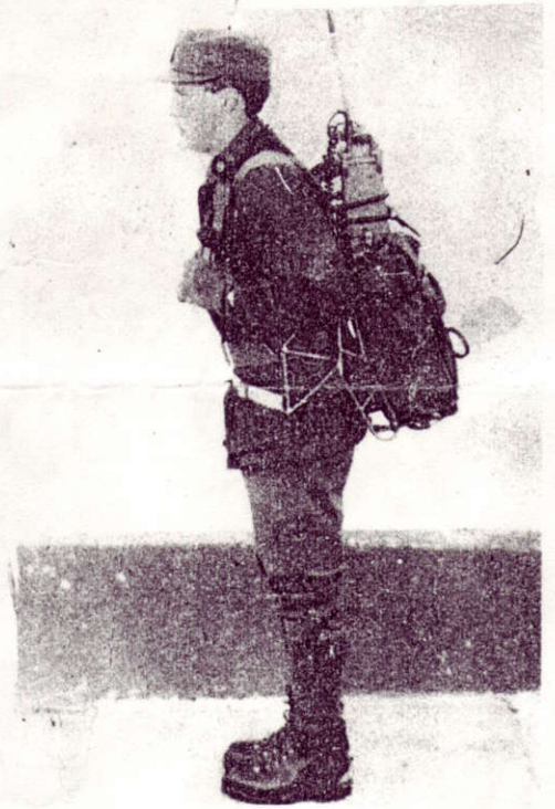
fig. a - 2